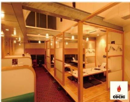
最多可容纳100人的宴会（野田店）