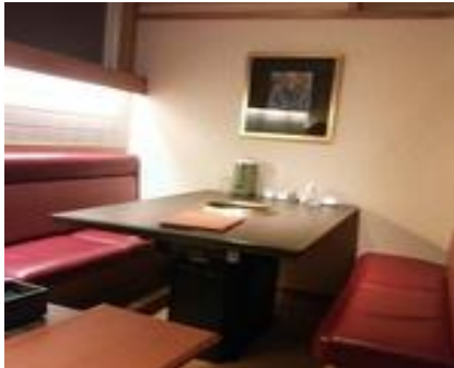
准备了情侣餐座（大元店）