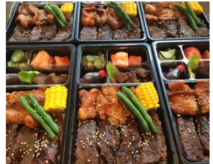
好吃可口的千屋牛便当

大元本店：营业时间 【周一，二，三，四】 16：30～24：00 【周末】 11：00～14：30 16：30～24：00 野田店：营业时间 【周一】 17：00～23：30 【周二～周日】 11：00～14：30 17：00～23：30